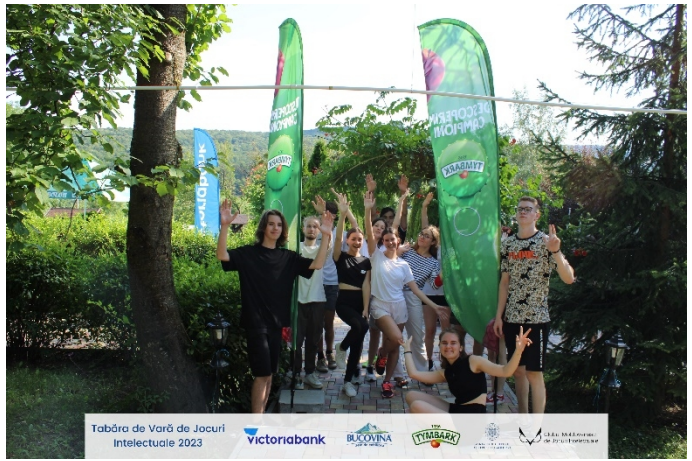
Tabăra de Vară de Jocuri Intelectuale 2023