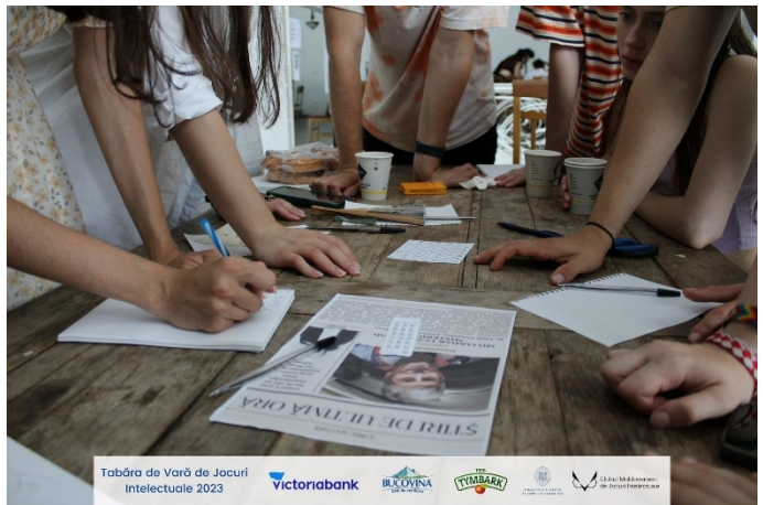
Tabăra de Vară de Jocuri Intelectuale 2023