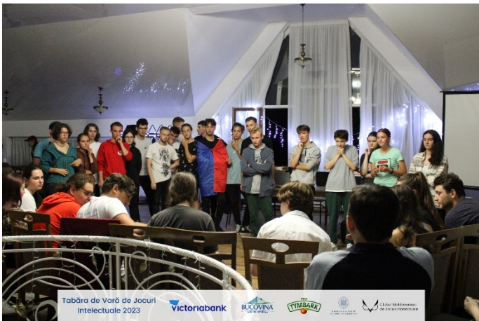
Tabăra de Vară de Jocuri Intelectuale 2023