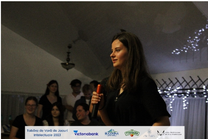
Tabăra de Vară de Jocuri Intelectuale 2023