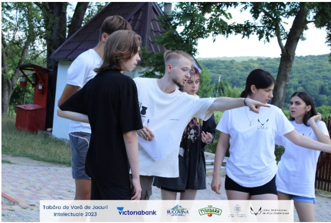
Tabăra de Vară de Jocuri Intelectuale 2023