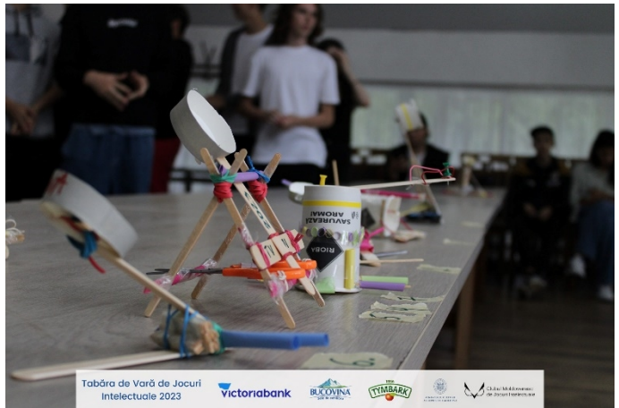
Tabăra de Vară de Jocuri Intelectuale 2023