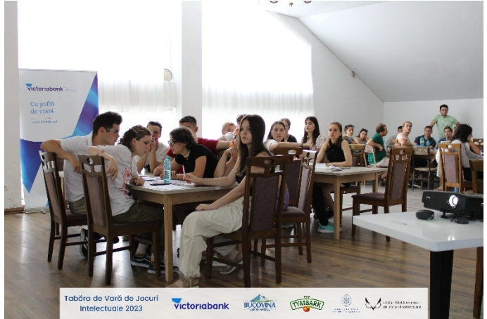
Tabăra de Vară de Jocuri Intelectuale 2023