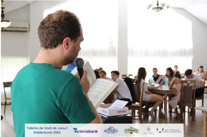
Tabăra de Vară de Jocuri Intelectuale 2023